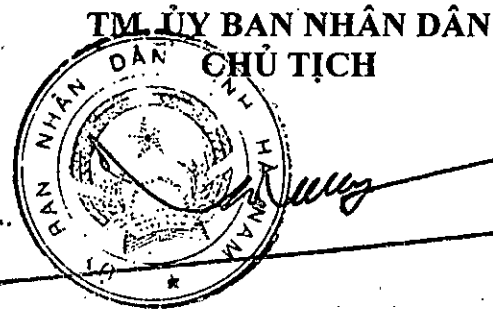
Trương Quốc Huy